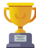
Trophée R2B Onco 2019

MABLINK Bioscience est une jeune société de biotechnologie qui prend sa place dans le secteur de l'immuno-oncologie . La technologie brevetée de MABLINK permet de conjuguer un anticorps à plusieurs molécules-médicaments (appelés ADC – Antibody Drug Conjugate), révolutionnant les traitements de pointe en clinique. En 2019, MABLINK a remporté le label French Tech Seed et le trophée R2B Onco.